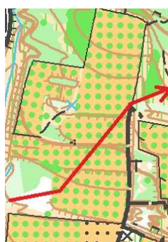
Trajet à éviter absolument

Les circuits de la seconde course sont partiellement en zone cultivée. Pour préserver nos bonnes relations avec les agriculteurs, merci de ne pas couper à travers les champs (y compris vergers et vignes) mais passer en bord de cultures. Le CLMD étant terminé, vous n'êtes plus à quelques secondes près !