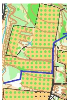
Trajet à privilégier

Dans la zone sud, le circuit H (H/D10) passe à proximité d'un champ comportant des ruches signalées sur la carte en zone interdite, veuillez éviter cette zone.