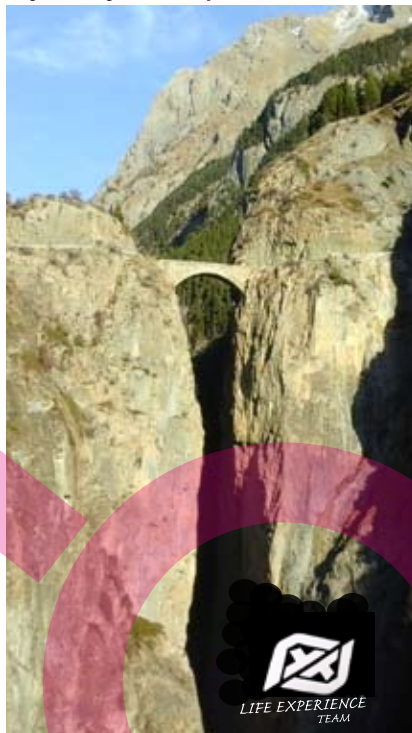
Le pont du Châtelet

Informations et inscriptions sur www.aventure-ubayenne.fr 06 78 33 38 26 aventure.ubayenne@gmail.com